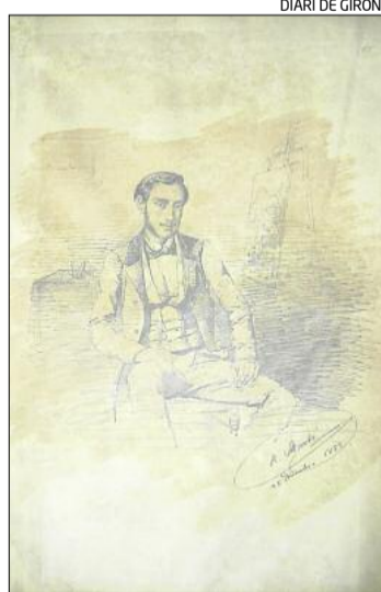
El retrat de Monturiol adquirit.

És precisament en aquest context on s'emmarca el retrat de Narcís Monturiol, en tant que ambdós es van conèixer a Barcelona a mitjan anys quaranta,