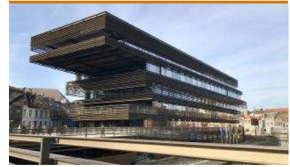
RCR a Gant