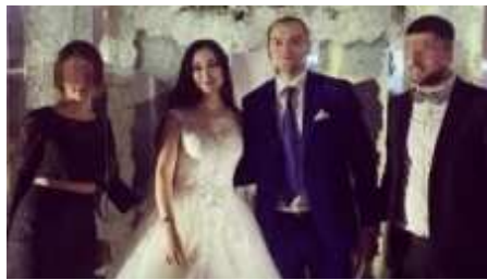
Final de la boda "de oro". Lo que resultó comprobar Hahalevov