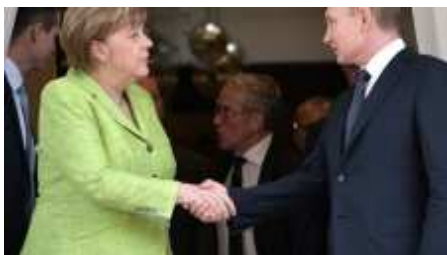
"¿Dónde está ruso?" - periodistas estadounidenses indignados