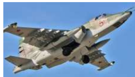
"Supergrachi": el valor de la única Su-25SM3