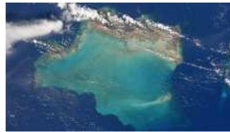
Paradise Island antes y después del cosmos: lo ha hecho "Irma"